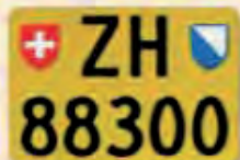
Mopedy a dočasně připuštěné motoroky