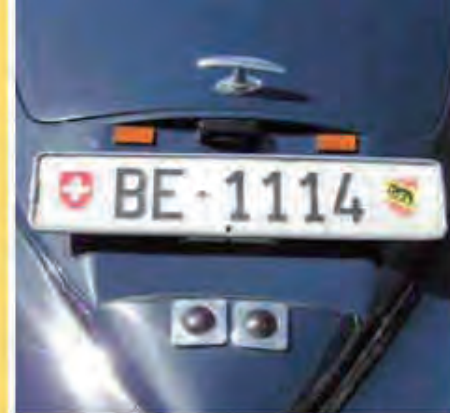
Delahaye z kantonu Bem

Jedením z mála manuálních úkonů v STVA mě přímo zaskočil: narovnávání a kosmetika čísel. Dokonce je za tímto účelem v provozu speciálně vyrobený stroj „vyrovnávačka čísel“.