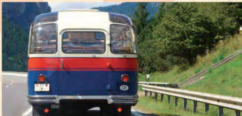
TI 9 – Kanton Tessin/Ticino – výletní Saurer