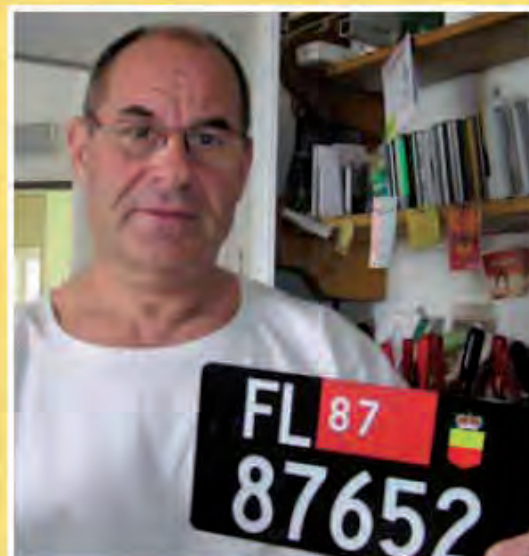
Lichtenštejnská SPZ neprocleného auta. FL znamená Knižectví lichtenštejnské