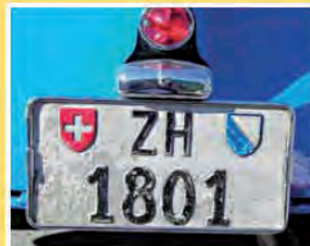
Peugeot Darl'mat 1. majitel kanton Zürich