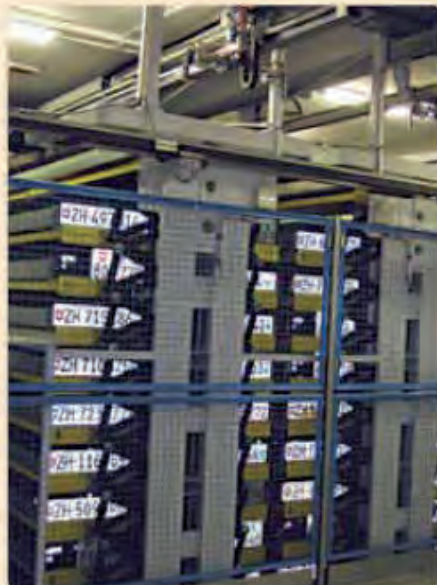
Plně automatizovaný archiv SPZ

Za posledních 100 let se švýcarské SPZ změnilo jen co do formátu – jsou o trochu menší než kdysi a mají reflektující podklad. Kolik desítek tun zbytečně promrhaného hliníku, pracovních hodin a dalších výdajů se za tuto dobu ušetřilo je jen těžko vyčíslitelné. Jasně je jedno: jedná se o jednoduchý a logický systém, proto se nemění.