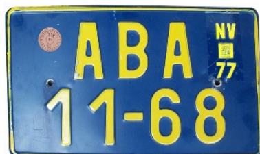
Cizinecká vzor 1979 (Praha)