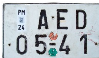
Vzor 1986 (Praha)